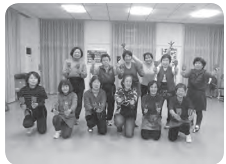
ダンスメンバーと一緒に

私は、老人クラブに入っています。これから歳をとっても、いつまでも楽しくよさこいを踊りながら余生を送りたいと思います。とにかく楽しくが一番です。