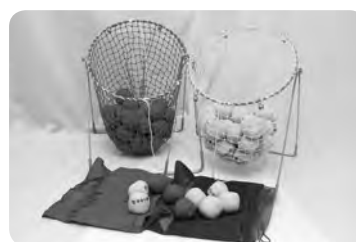
フロア玉入れセット