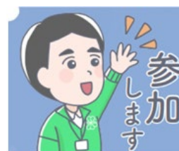
LINEスタンプの デザインイメージ(例)

委員同士のコミュニケーションで良く使われるフレーズ等を用いたLINEスタンプを販売し、活用を通じて民生委員・児童委員活動の社会的認知の向上を図ります。